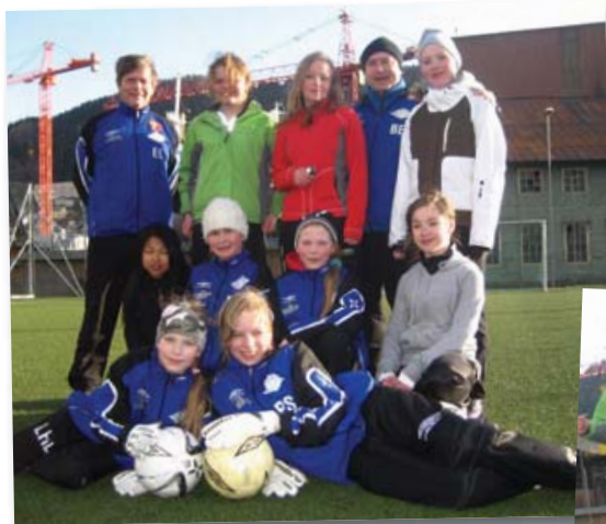
Over: Jenter-94. Til høyre: Kamp om ballen under en J-94-trening.