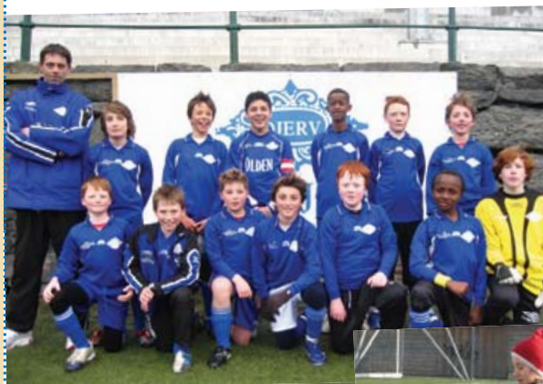
Over: Gutter -94. Til høyre: Opplegg til hel volley under trening for jenter -94.