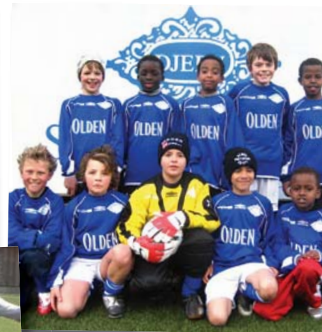
Over: Gutter -97.