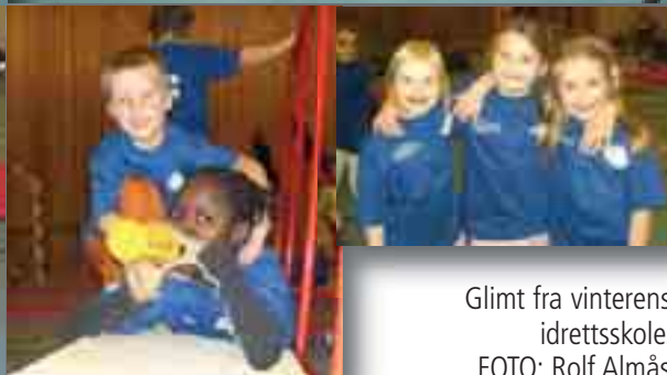
Glimt fra vinterens idrettsskole.

Nygårdsparken. Idrettsskolen avslutter til sommeren med grillfest i parken.