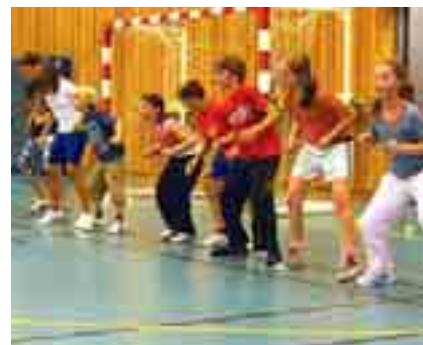
Friske fysiske øvelser for å få opp pulsen.