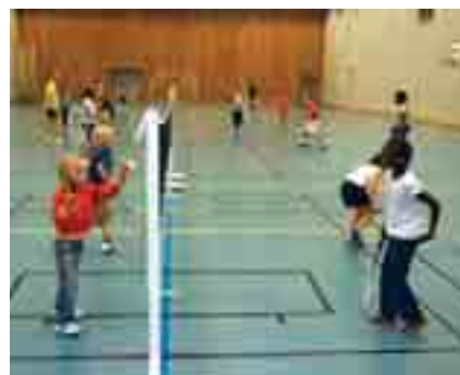
Men det skal jo spilles også!